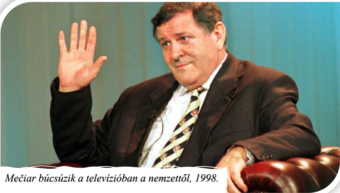
Mečiar búcsúzik a televízióban a nemzettől, 1998.

köztársasági elnök fiát elrabolták a titkosszolgálatok, a rablásról valló tiszt pedig zavaros körülmények közt autóbalesetet szenvedett. Bár Mečiar és pártja baloldalinak tartotta magát, Szlovákia jövőjét a nacionalista protekcionizmusban látta, s emiatt csak mérsékelt érdeklődést mutatott a Nyugat felé nyitáshoz, így a NATO-hoz és EU-hoz való csatlakozáshoz. Végül Mečiar kormányzatát 1998-ban sikerült megdöntenie egy, a kormánypárt ellen megszerveződött nagykoalíciónak – mely többnyire az ellenzéket alkotó, középre szorult jobboldaliakból állt –, Mikuláš Dzurinda vezetésével.