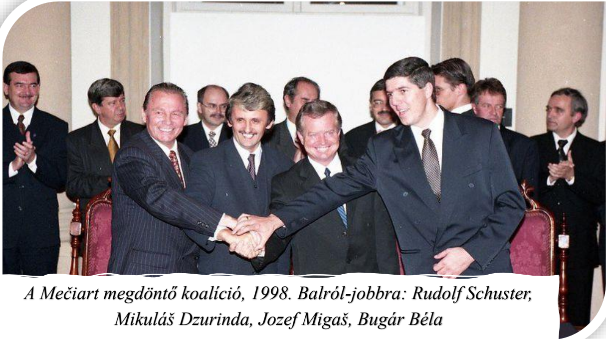
A Mečiar megdöntő koalíció, 1998. Balról-jobbra: Rudolf Schuster, Mikuláš Dzurinda, Jozef Migaš, Bugár Béla

mind a NATO, mind az EU hivatalos tagjaivá váltak, mi több, hamarosan csatlakoztak az eurózónához is. 2006-ban a Dzurinda kormány helyét ismét a baloldal vette át a Robert Fico vezette SMER-rel.