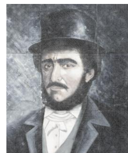
Gróf Széchenyi István

Mint ahogyan az Üllői és Soroksári utak által körülölelt 230 holdas pesti legelő szilaj homokját fogták meg jófajta eperfák béültetésével Wesselényi báró, Heinrich kapitány és a gondos egyesületi tagok, csak úgy kezdé meghonosíttatni Magyarországon is a lófuttatást Széchenyi István gróf úr.