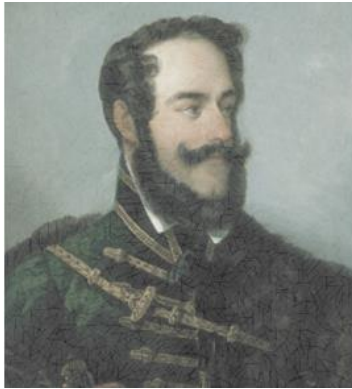
Báró Wesselényi Miklós