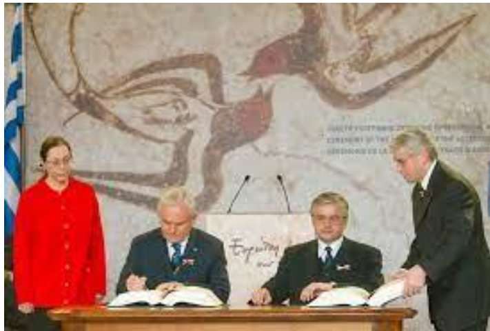
Leszek Miller (bal oldalon) és Włodzimierz Cimoszewicz (jobb oldalon) aláírják az Európai Unióba való csatlakozásról szóló szerződést

Lengyelország 1990-ben kezdődő gazdasági átalakulása sok közgazdász szerint az egyik leghatékonyabbnak bizonyult a régió más országainak átalakulásai közül. Ugyanakkor az idősebb generációk nehéz és a kifejezetten nagy nélkülözést hozó időszaknak nevezik azt. Ebben a cikkben azzal fogunk foglalkozni, hogy mi igaz és mi nem ezek az állítások közül. Részletesen meg fogjuk nézni a transzformáció gyökereit, elért céljait és nem utolsósorban a mellékhatásait. Mivel nemrég sikerült az Európai Unióba való csatlakozásról szóló 2003-as szerződést aláírnia a lengyel miniszterelnöknek, Leszek Millernek, a külügyminiszternek, Włodzimierz Cimoszewicznek, és az európai ügyekért felelős miniszternek, Danuta Hübnernek is, ezért megvizsgáljuk azt is, hogy az Európai Unióba való csatlakozás hogyan befolyásolhatja az ország gazdaságát.