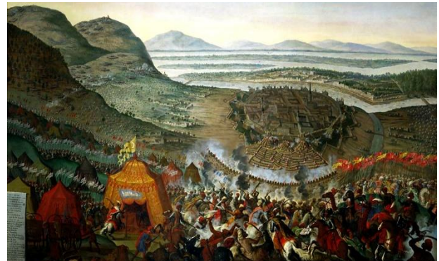
Törökök Bécs alatt 1683-ban

A felismerés lassan jött el, erre egészen pontosan 1683-ig kellett várnunk, kedves olvasóink, amikor egy szép júliusi napon, Bécs kapuján bekopogtatott Kara Musztafa nagyvezír, cirka 150 ezer fős szultáni sereggel a háta mögött.