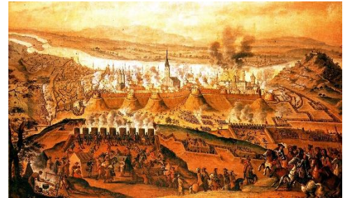
Buda ostroma és a tűzvész

A törökök óriási fürdőket hagyva maguk után lettek kiűzve a városból. A háború okozta károk és a várfal javítása miatti fáradalmakat katonáink itt pihenhettek ki végre.