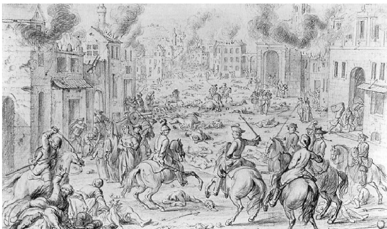
krétarajz a budai fosztogatásról

Nyár kezdetén érkeztek meg a Szent Liga csapatai, hogy megpróbálják Buda visszavételét. A 70-80 ezres keresztény sereget magyarok, spanyolok, franciák, horvátok, románok és még sok más nép fia alkották, hogy együtt küzdjenek a törökök ellen. Pestet az oszmánok már június 17-én kiürítették, Budát az ostromló sereg másnapra zárta körbe. A legmodernebb haditechnikát