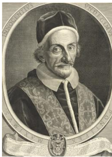
IX. Ince pápa

merülhet fel néhány figyelmes olvasónkban a kérdés. Nem, nem azért, mert szerkesztőségünk elrontotta, hanem mert Bécs nem esett el! Lipót császár pontosan ettől és a franciáktól tartva, már januárban katonai szövetséget kötött II. Miksa Emánuel bajor választófejedelemmel, IX.