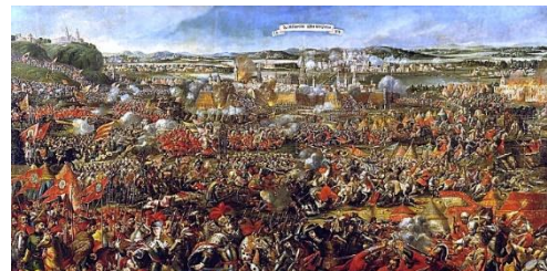
Bécs felszabadítása Kahlenberg környékén

Ince pápa közbenjárására pedig a lengyel Sobieski Jánossal is szerződést kötött. 3 A megállapodásuk tartalmazta, hogy Krakó és Bécs kölcsönösen segítik egymást egy esetleges ostrom esetén. Így amikor IV. Mehmed szultán Thököly Imre felvidéki sikereit látva, kiadta a parancsot Bécs újbóli